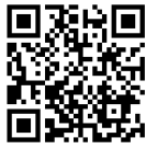
コトパット説明動画

音声をリアルタイムで認識し、文字・図解・動画をスクリーンに表示することで、会話の聞き取りづらさを解消し、コミュニケーションを円滑にします。相手の表情を見ながら安心して会話することができ、発話者もスムーズに情報を伝えられるため、さまざまな窓口業務でのサービス向上や対応時間の短縮などに貢献します。